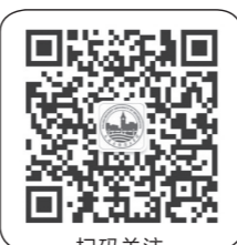
扫码关注 大连东软信息学院 官方微信公众号 dnuic2000