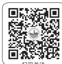
扫码关注 大连东软信息学院财务平台 微信公众号 DNUICW

党委学生工作部负责学生思想政治教育、学生日常管理各类事务性工作，包括迎新活动、开学典礼举办、军训组织、出入校园管理、奖助学金评比、征兵补偿、纪律处分、心理咨询、寝室调整、社会保险、医疗保险及走读办理等，与学生切身利益和日常校园生活紧密相关，该平台将发布各类最新资讯。