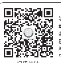
扫码关注 大东软学生工作 微信公众号 dnuic-one_stop

党委学生工作部负责学生思想政治教育、学生日常管理各类事务性工作，包括迎新活动、开学典礼举办、军训组织、出入校园管理、奖助学金评比、征兵补偿、纪律处分、心理咨询、寝室调整、社会保险、医疗保险及走读办理等，与学生切身利益和日常校园生活紧密相关，该平台将发布各类最新资讯。