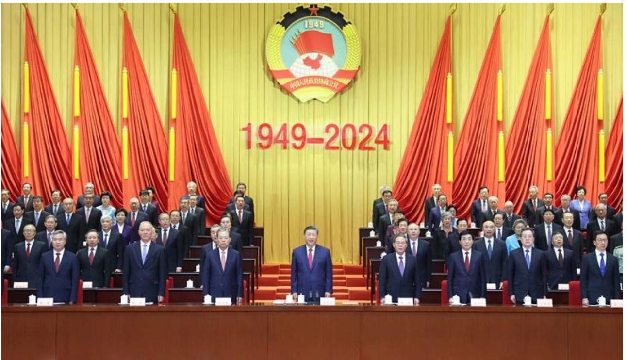
9月20日上午，中共中央、全国政协在全国政协礼堂隆重举行庆祝中国人民政治协商会议成立75周年大会。习近平、李强、赵乐际、王沪宁、蔡奇、丁薛祥、李希、韩正等出席大会。