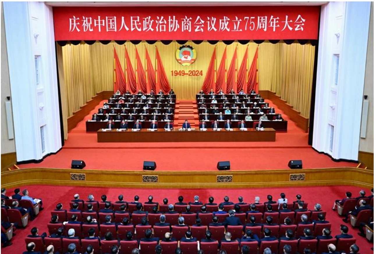
9月20日上午，中共中央、全国政协在全国政协礼堂隆重举行庆祝中国人民政治协商会议成立75周年大会。习近平、李强、赵乐际、王沪宁、蔡奇、丁薛祥、李希、韩正等出席大会。

中共中央政治局常委李强、赵乐际、蔡奇、丁薛祥、李希，国家副主席韩正出席大会。中共中央政治局常委、全国政协主席王沪宁主持大会。